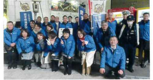
岩手県代協 飲酒運転撲滅街頭キャンペーン (2023年12月1日)