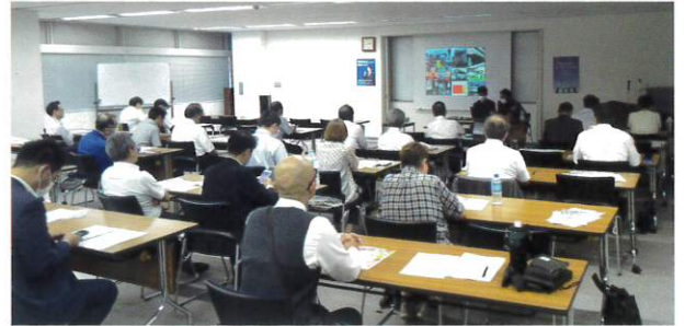
岡山県代協 「日本赤十字社による献血推進セミナー」(2023年7月5日)

日本代協、各都道府県代協は、会員向けに「経営マネジメント」や「防災・減災の取り組み」等、本業に資する様々なセミナーを開催しています。また、総会や賀詞交歓会、記念式典等に保険会社等の業界関係者を招待し、交流を深めています。