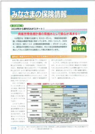
『みなさまの保険情報』

お客さまに常に新しい情報をお届けするためのツールとして、情報誌「みなさまの保険情報」(年4回発行)を代協会員に幹旋し、現在約5万部が利用されています。