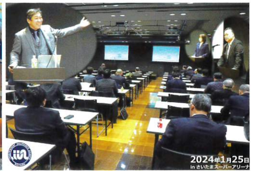
埼玉県代協 「仕事をしたくなる仕組みづくりを目指して」 (2024年1月25日)