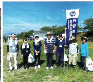
青森県代協 第38回奥入瀬川クリーン作戦 (2023年8月27日)