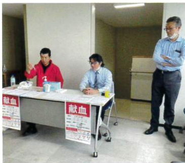
神奈川県代協 (2023年6月2日)