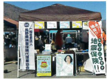
長野県代協(2023年12月9日)