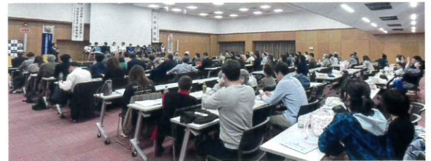
大分県代協 「『温故知新』と『居安思危』で大地震を凌ぎ『転禍為福』」 (2023年10月28日)