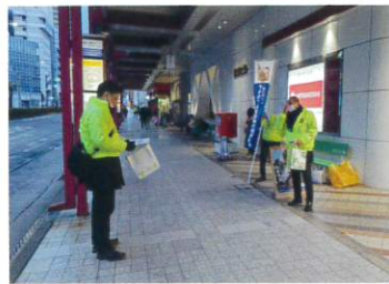
やまがた代協(2023年11月28日)