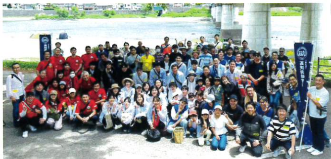
高知県代協 仁淀川清掃活動 (2023年5月27日)