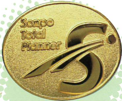
損害保険 トータルプランナー 認定バッジ

一般社団法人日本損害保険協会（損保協会）は、損保協会の「損害保険代理店専門試験」と日本代協の「保険大学校・認定保険代理士制度」を統合した「損害保険大学課程」を、2012年7月から展開しています。この制度の運営にあたり、日本代協は指定教育機関として、教育プログラムの策定・運営を行い、業界全体の募集人教育を下支えしています。