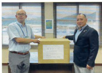
北海道代協 タオルボランティア (2023年8月9日)