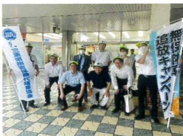
三重県代協 (2023年9月15日)

交通事故が起きた場合、被害者だけでなく、加害者にも賠償責任義務による金銭的負担や精神的負担が強いられます。日本代協では、毎年9月に国土交通省と共同で、交通事故被害者の対人賠償の確保と加害者の経済的負担を補う自賠責保険の普及を目的とした「無保険車追放キャンペーン」を実施しています。