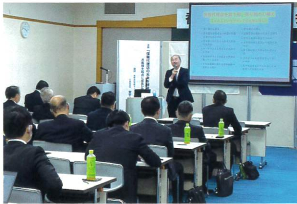
香川県代協 「保険代理店の未来を継承する心構え ～お客様を起点に成長か撤退かを決める～」 (2023年5月29日)