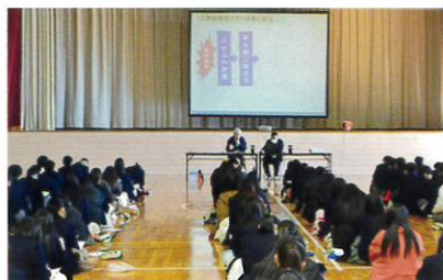
茨城県代協(2024年1月10日)