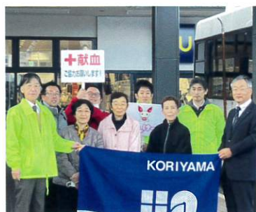
福島県代協 (2023年11月11日)