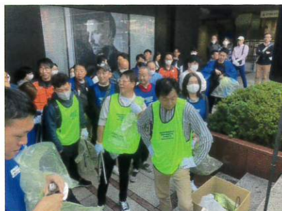
和歌山県代協 和歌山駅おもてなし大清掃 (2023年10月15日)