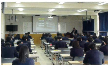
福井県代協(2024年1月17日)