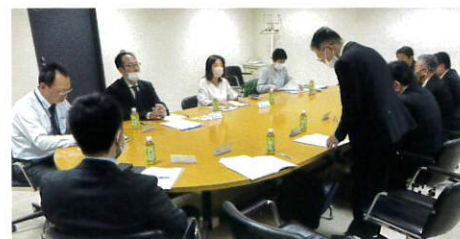
岐阜県代協(2023年11月14日)