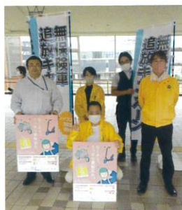
秋田県代協 (2023年9月21日)