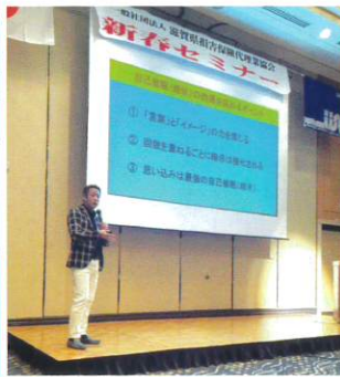
滋賀県代協 「簡単！すぐにできる！ 自分を変えるメンタル睡眠心理」 (2024年1月23日)