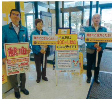
富山県代協 (2023年10月29日)