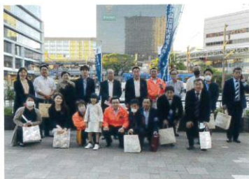
鹿児島県代協(2023年10月25日)

日本代協は、新潟県中越地震が発生した10月を「地震保険の月」と定め、「地震保険の保険金は被災時の生活再建資金となり、生活の早期安定に資する」ことを毎年全国で訴えています。