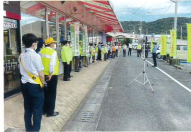
山口県代協 夏の交通安全キャンペーン (2023年7月13日)