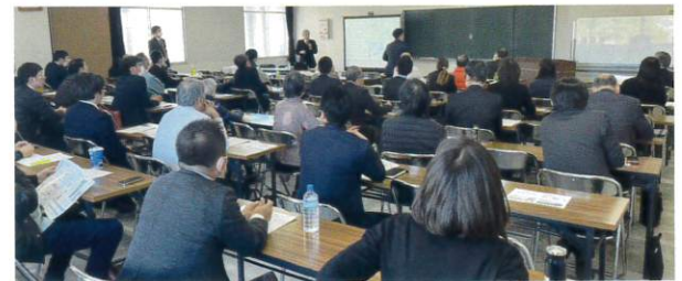
鳥取県代協 「山陰の地震と日本列島の大地変」(2024年1月17日)