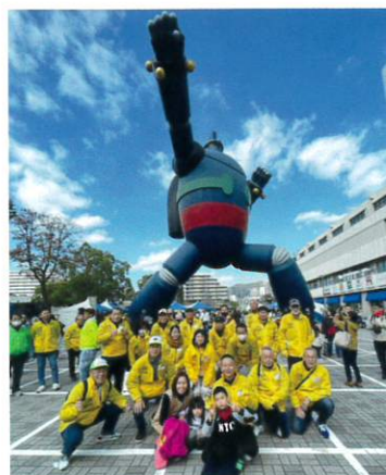
兵庫県代協 「第11回神戸マラソン」ボランティア (2023年11月19日)