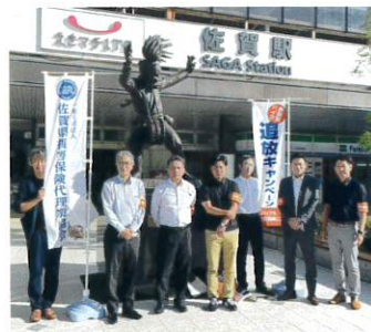
佐賀県代協 (2023年9月25日)