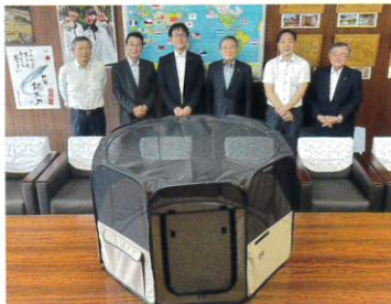
熊本県代協 ペット同行避難所用 折りたたみ サークル寄贈(2023年7月10日)