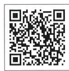
代理店賠償『日本代協新プラン』のご案内