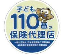
「子ども110番の保険代理店」ステッカー