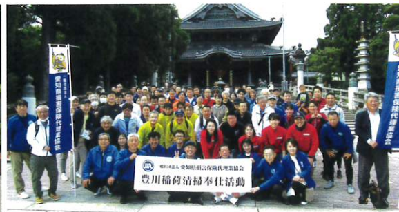
愛知県代協 豊川稲荷清掃奉仕活動 (2023年10月21日)