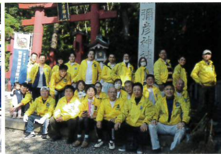
新潟県代協 弥彦神社清掃 (2023年11月3日)